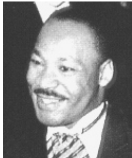
Martin Luther King