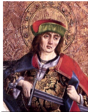
Martin de Tour